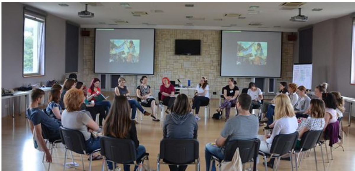
Trening za udruge o zaštiti i zagovaranju prava različitih obitelji, Zadar, 2-3.6.2016.