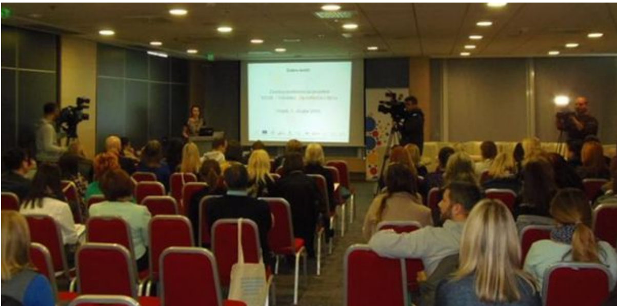
Završna konferencija projekta Vizije, Osijek, 1.3.2016.

Nakon što je 2015. godina bila u znaku istraživanja o socijalnim uslugama koje se u Hrvatskoj i EU pružaju ranjivim skupinama roditelja, edukaciji volonterki i volontera te radu mobilnih timova, 2016. godina bila je u znaku distribucije publikacije Potrebe roditelja i pružanje usluga roditeljima koji podižu djecu u otežanim okolnostima autorica Ninoslave Pećnik, Ivane Dobrotić i Jelene Baran. Kraj projekta obilježile su pripreme za završnu konferenciju u Osijeku koja je pred gotovo 80 sudionica i sudionika iz 15 hrvatskih gradova održana 1. ožujka 2016.